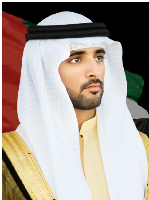
H.H Sheikh Hamdan Bin Mohammad Bin Rashid Al Maktoum

Crown Prince of Dubai Chairman of the Executive Office of Dubai