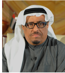
H.E Lt. Gen Dhahi Khalfan Tamim Chairman IFTDO 2014 Chief of Dubai Police