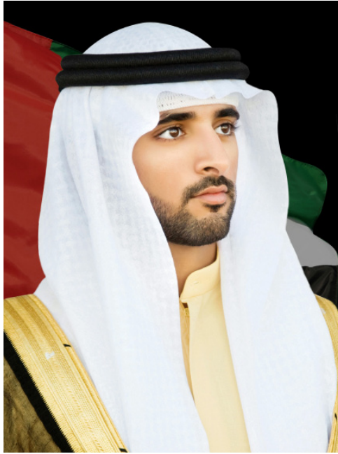
صاحب السمو الشيخ حمدان بن محمد بن راشد آل مكتوم ولي عهد دبي رئيس المجلس التنفيذي